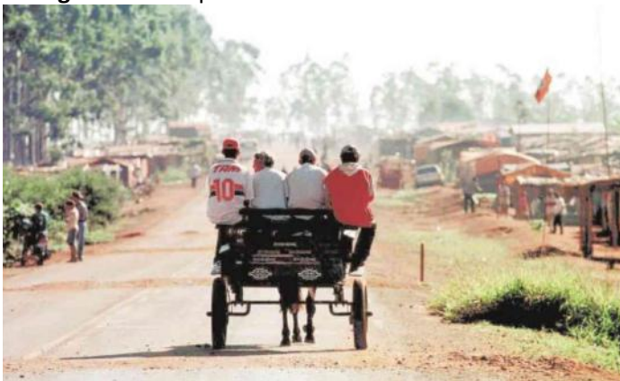
Imagem 1: Acampamento do MST