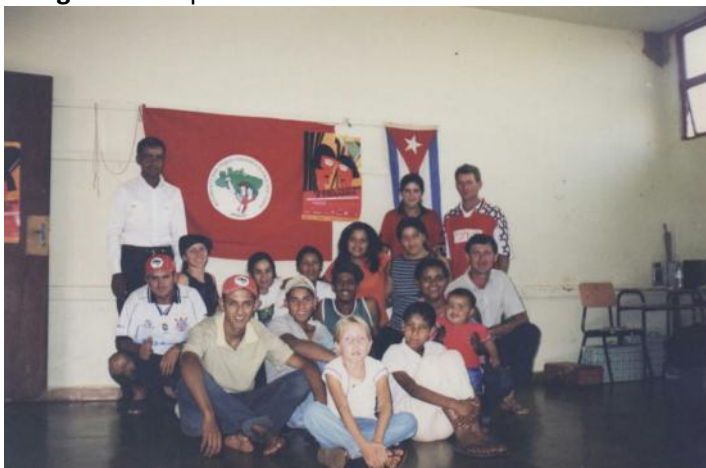
Imagem 2: Grupo de teatro do MST

Neste diálogo, o assentado narrou sobre a importância da mística como uma prática simbólica para o fortalecimento da resistência e da construção de novos valores no fazer-se da luta e permanência na terra. Em sua narrativa, o MST representa homens e mulheres do campo que buscam justiça social, o direito à terra e nela condições dignas para viver. Portanto, naquele período, era necessário fortalecer a resistência coletiva entre os sem-terra, sobretudo diante das incertezas do futuro após a conquista dos assentamentos.