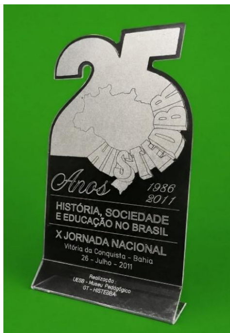
Imagem 4 – Placa em homenagem aos 25 anos do Histedbr, em 2011, produzida em acrílico.