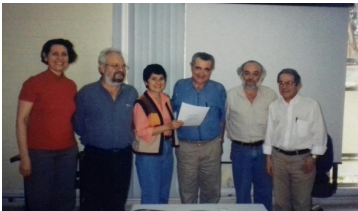
Imagem 2 – Os membros da Banca Examinadora com a doutoranda.