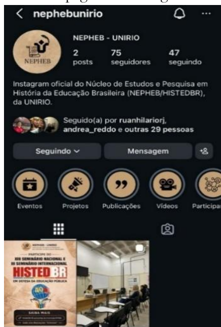
Imagem 6 – Print da página do Instagram do Nephéb