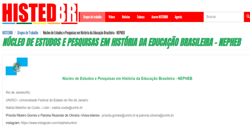
Imagem 5 – Print atual da página do HISTEDBR com o Nepheb como um dos GTs