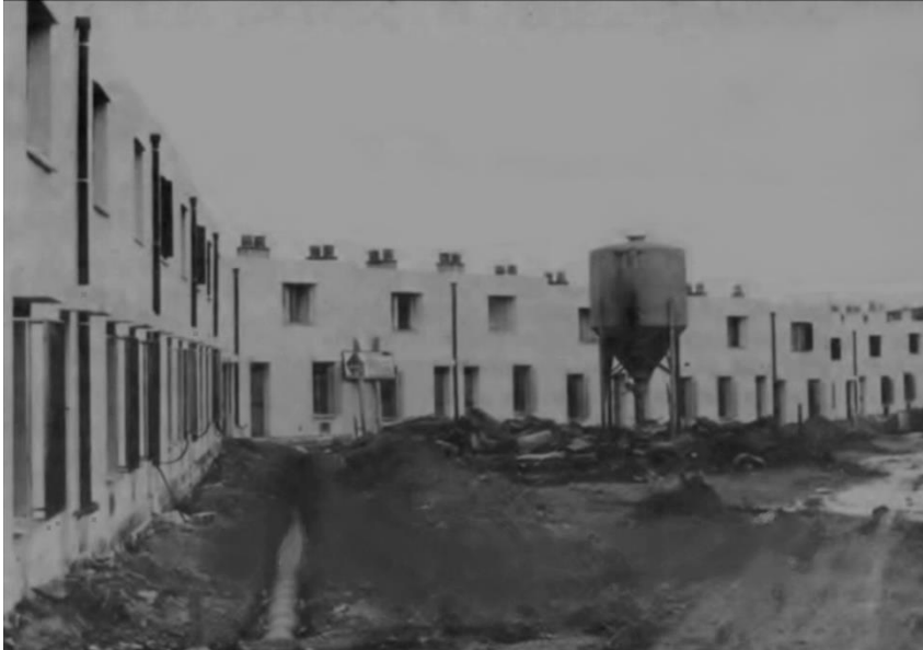
Figura 3: Quinta Julieta, ano de 1982

periféricas, principalmente em Quinta Julieta em 1982 (ver figura 2 e 4), uma área localizada em Torrero, onde se tentou erradicar o chabolismo ou barraquismo inutilmente, pois no gueto construído, a insalubridade, o superpovoamento, a alta taxa de natalidade e o alto índice de criminalidade eram variáveis diárias medidas pelos executores das políticas sociais, e sua avaliação os levou a tomar a decisão de dismantelar a Quinta Julieta sete anos depois, em 1989, e distribuir a população cigana pelo restante da cidade. Evidentemente, colocar a população cigana em um gueto não era a solução, embora fosse um primeiro passo para sua integração ao restante da sociedade espanhola (Enciclopédia Aragonesa, 2020).