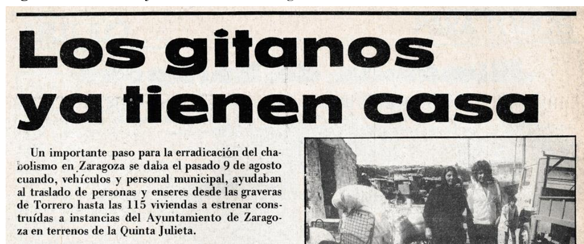
Figura 4: Recorte do Jornal Heraldo de Aragão. 1981.