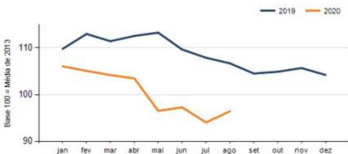
Gráfico 1 – Evolução dos níveis de emprego Região Oeste – PR