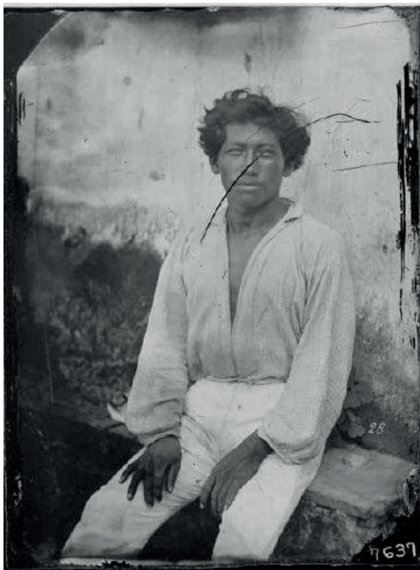
Fotografia 5.1 – “Retrato de tipo racial, homem não identificado”