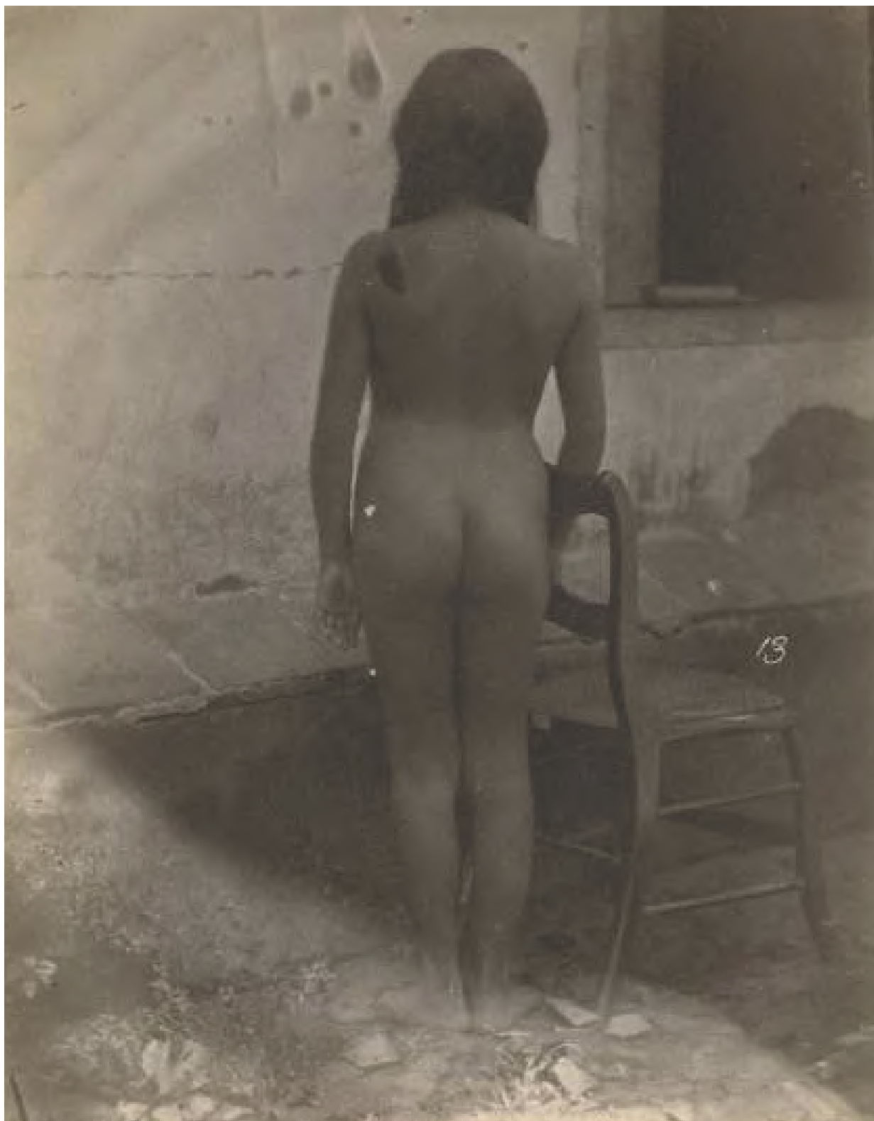
Fotografia 5.4 - “Retrato somatológico, mulher não identificada”