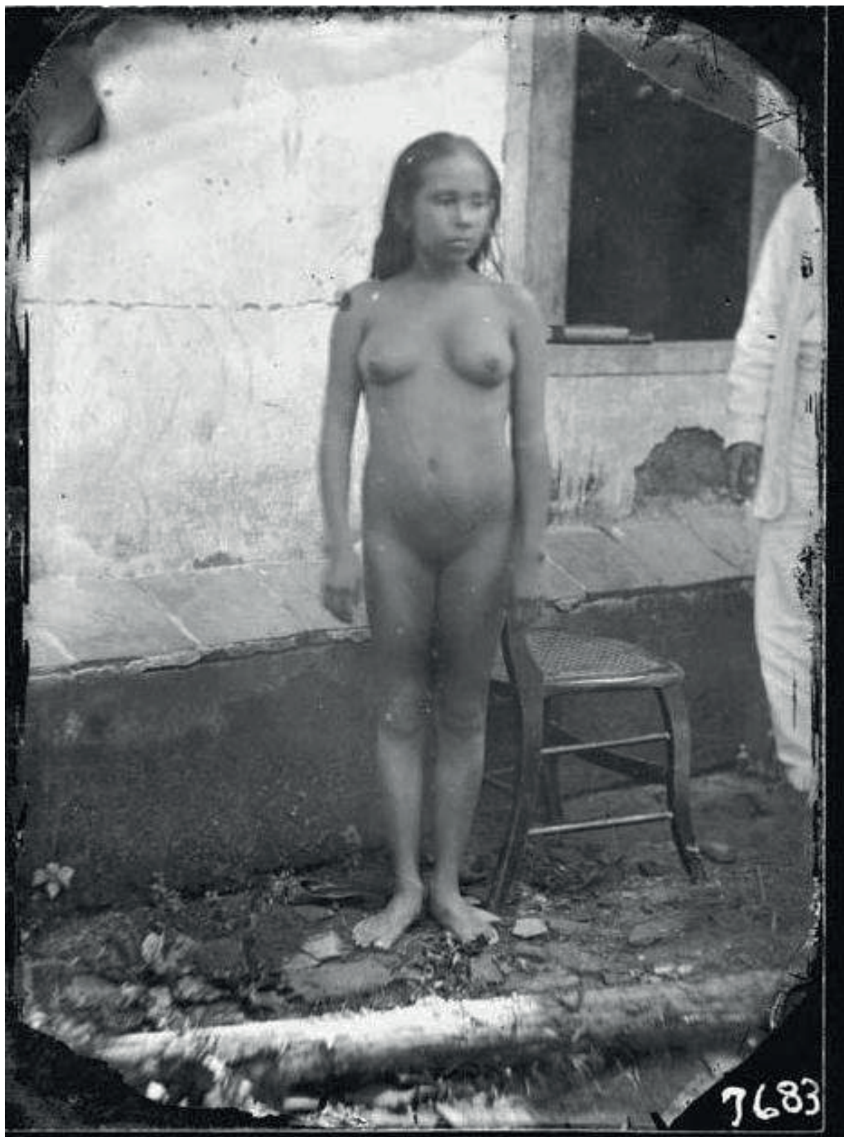
Fotografia 5.3 - “Retrato somatológico, mulher não identificada”